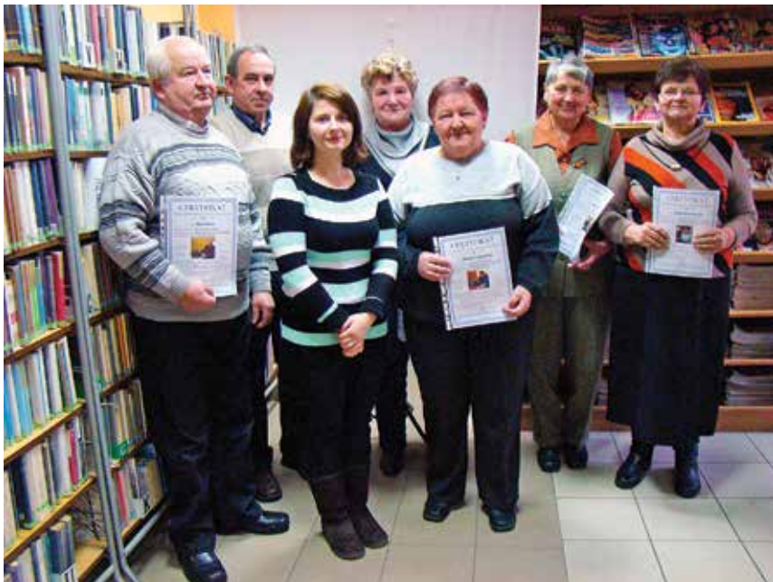
Kolejni już kursanci, którzy ukończyli szkolenie z obsługi komputera i internetu.

Polska Cyfrowa Równych Szans to program powszechnej edukacji cyfrowej dorosłych Polaków (50+) w ich lokalnych środowiskach. Inicjatywa PCRS jest inicjatywą Stowarzyszenia „Miasta w Internecie” wspartą przez grupę ogólnopolskich organizacji i koalicji, jak również przez Ministerstwo Administracji i Cyfryzacji. W ramach PCRS działają Latarnicy, którzy w sposób zaangażowany oświetlają drogę przyszłym użytkownikom komputera i Internetu.