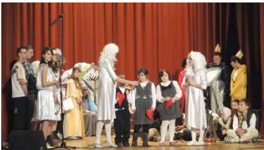
Dzieci włożyły wiele pracy w przygotowanie barwnych spektakli.

Zarówno nauczyciele, jak i wszystkie występujące dzieci włożyły wiele pracy w przygotowanie barwnych, rozbudowanych i ciekawych spektakli. Budynek COK w tym dniu przez wie-