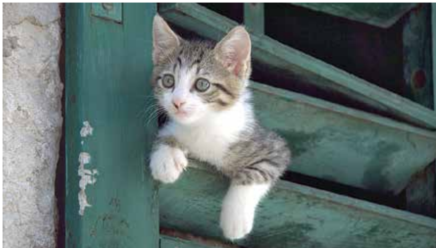
Koty wolno żyjące zapobiegają zagnieżdżaniu się i rozmnażaniu gryzoni.

Odróżnienie kota wolno bytującego od zabłąkanego kota domowego jest bardzo proste – zdrowego kota wolno żyjącego nie uda się ot tak, bez problemu (np. bez specjalnych urządzeń) złapać, za to chory, niezdolny do ucieczki, będzie syczał, gryzł i drapał podczas próby udzielenia mu pomocy lub zastygnie nieruchomo w kącie. Kot domowy z reguły szuka towarzystwa człowieka, podchodzi do niego, daje się karmić i głaskać. O bezdomnych kotach domowych (oswojonych) należy powiadomić odpowiednie służby – Straż Miejską w Cieszynie (986), Policję (997) lub Fundację „Lepszy Świat” (782 71 77 71). Zostaną one zabrane do domów tymczasowych, w których będą czekać na swój nowy prawdziwy dom. Natomiast populację kotów